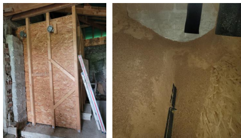
Silo dans la grange, construit sur mesure pour la chaudière et pour les besoins de la maison

Plan de la maison avec la chaufferie au centre