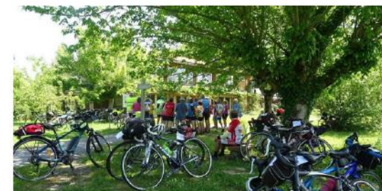
▲ 75 cyclotouristes ont fait étape à Riscle, mardi dernier, pour une visite guidée de l'écocentre Pierre et terre.

S'ABONNER À PARTIR DE 1€ f t in 0 COMMENTAIRE