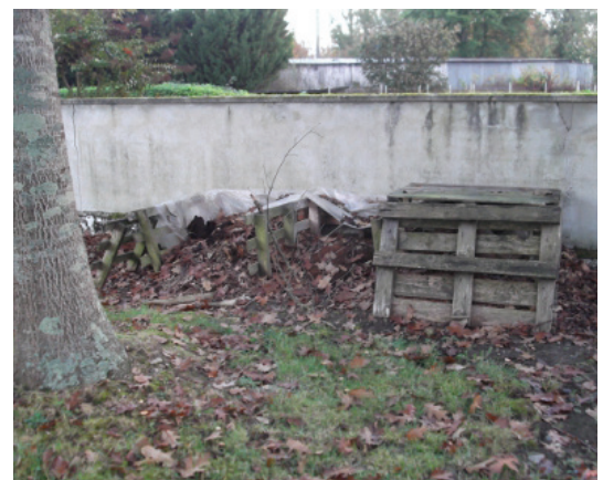
Station de compostage : trois bacs bac à droite fermé + deux bacs (n+1 et n+2)

Plus d'info sur le site de l'école : http://pagesperso-orange.fr/ecole-cahuzac/