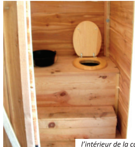
l'intérieur de la cabine

Au bout de 7 ans, l'expérience suit son cours. Les élèves gèrent eux mêmes tout le processus depuis le vidage des containers jusqu'au compostage du produit. Pour la première fois en 2010 le compost assaini a été utilisé dans le jardin pédagogique.