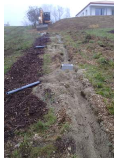
Vue depuis le bas du système avant recouvrement : les tuyaux arrivent au dessus des tranchées remplies de BRF