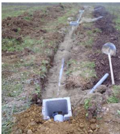
Vue du système depuis le premier regard répartiteur