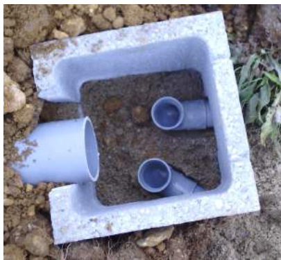
Premier regard répartiteur avant étanchéité