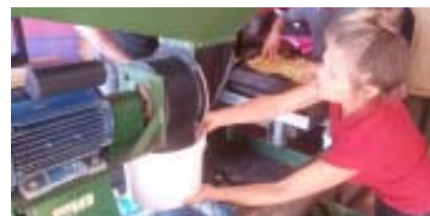
Récupération et pressage du broyat de pomme