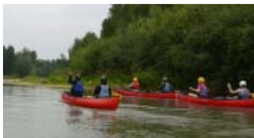
Découverte de l'Adour en canoë

Dans le cadre d'un vaste programme initié par l'association Prioriterre et soutenu par le Conseil Général du Gers, les collèges de Vic Fezensac, Aignan, Eauze et Marciac s'engagent en faveur de la maîtrise des dépenses énergétiques. Pour ce faire, personnel et élèves, accompagnés par Pierre & Terre, vont ensemble travailler pour changer leurs comportements, réfléchir sur le thème de l'efficacité énergétique dans le cadre des activités scolaires et éviter de gaspiller les watts grâce à de petits gestes simples... L'objectif du projet : développer les "bonnes pratiques" afin de faire baisser les consommations énergétiques des établissements scolaires !