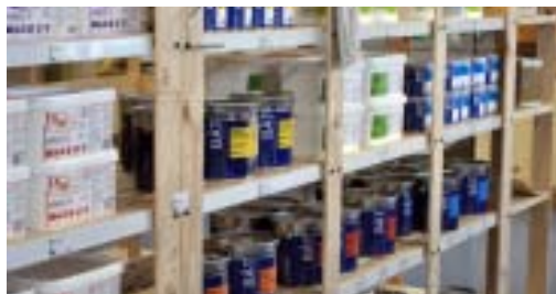
Aujourd'hui, il est facile de trouver des matériaux écologiques en boutique spécialisée mais aussi chez les marchands de matériaux conventionnels

Unis par une convention de 4 ans, la CAF et Pierre & Terre travaillent conjointement afin d'aider et accompagner les foyers les plus modestes qui le souhaitent à améliorer le confort de leur logement. Les préconisations faites par Pierre & Terre, après réalisation d'un écodiagnostic, permettent aux familles de réduire leurs consommations énergétiques grâce à des gestes simples. Des travaux peuvent également s'avérer nécessaires afin de rénover écologiquement des logements parfois très énergivores. En 2014, sur les 85 foyers accompagnés par Pierre & Terre, 14 ont bénéficié de dispositif CAF.