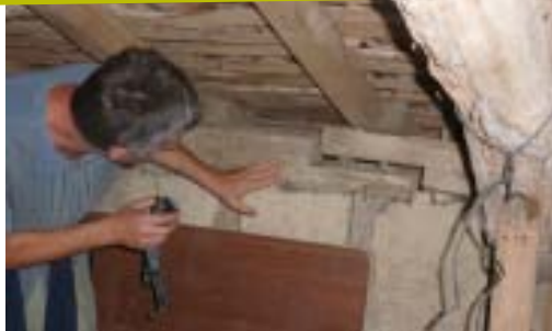
Etude des combles lors d'un écodiagnostic chez un particulier