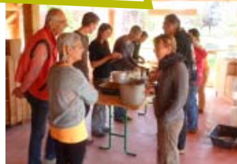
Atelier enduits terre à l'Écocentre