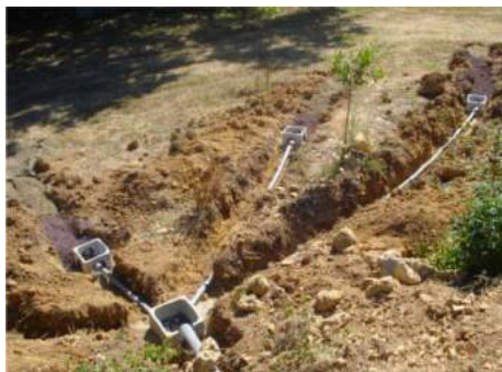
Tranchées remplies de plaquettes