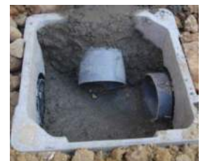
Regard de collecte des eaux grises