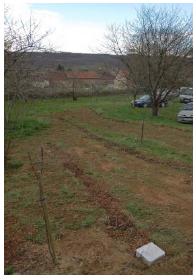
Tranchées remplies de BRF