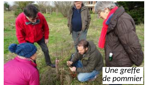
Une greffe de pommier

La taille douce et la greffe (en fente ou anglaise) des fruitiers ont rassemblé près de 20 personnes. Ceux qui en avaient besoin ont fait un petit détour par la Répare Party pour affûter leurs sécateurs et couteaux pour la pratique dans le verger de l'écocentre !