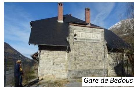
Gare de Bedous

...avec le projet FENICS en partenariat avec le Conseil Départemental des Pyrénées-Atlantiques (débuté en 2017).