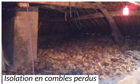
Isolation en combles perdus

...avec le Fond de Solidarité pour le Logement