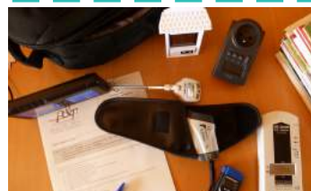
les outils de l'écodiagnostic : boussole, thermomètre, wattmètre, etc.

Un ménage témoigne avoir diminué de moitié sa consommation de chauffage et avoir gagné 5 à 6°C dans leur maison (avant : aucune isolation - après : 30 cm de ouate de cellulose en combles perdus).