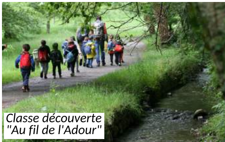
Classe découverte "Au fil de l'Adour"

Le partenariat historique avec la Maison de l'eau / Institution Adour permet de promouvoir des animations de sensibilisation sur la ressource en eau et le milieu aquatique : classes découvertes « Au fil de l'Adour », projets sur la durée avec plusieurs interventions autour de l'école, sorties à la Maison de l'eau, ou encore études de milieux spécifiques (zones humides, pelouses sèches).