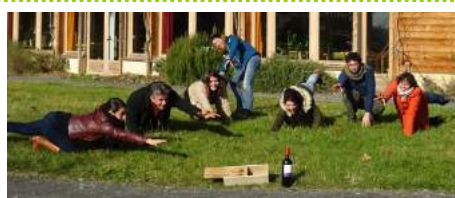
L'équipe a reçu une bouteille de vin d'Ecosec !

...ont été labellisés dans le Gers, dont celui de Nogaro que Pierre & Terre accompagne depuis 4 ans : un projet sur le long terme autour de l'alimentation et des déchets, en partenariat avec la cantine communale. Un vrai changement de comportement écocitoyen est observé aujourd'hui chez les enfants du CLAN !