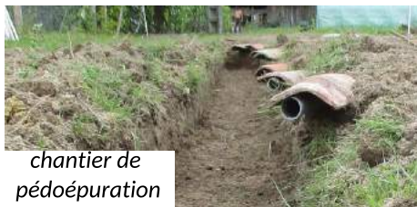
chantier de pédopuration

...en pédopuration ont été faits cet automne pour des particuliers. Il s'agit du système le plus simple et le plus écologique pour valoriser les eaux ménagères.