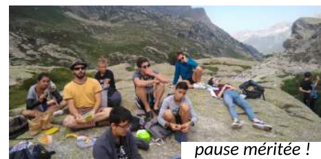
pause méritée !

...dont 3 jours en montagne (Ayous, Pont de Camps, train Artouste), 2 jours de bénévolat au Festival Jazz in Marciac et 2 jours de surf à Anglet. L'espace jeunes est ouvert toute l'année et compte 30 inscrits.