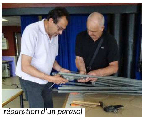
réparation d'un parasol