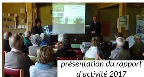
présentation du rapport d'activité 2017