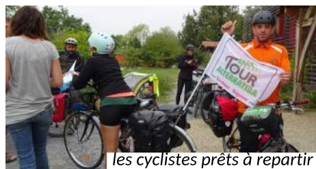
les cyclistes prêts à repartir

...a fait étape à Pierre & Terre dans leur tour étendu de Bordeaux à Bayonne. Un ciné-échanges sur leurs actions face au dérèglement climatique a réuni 28 personnes le 27 septembre.