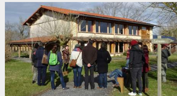
Visite guidée mensuelle de l'écocentre

Un public total de 10 462 personnes en 2017