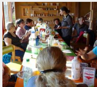
Atelier produits ménagers