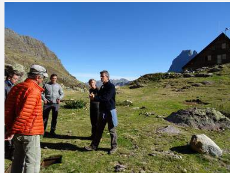
Rencontre sur le site d'Ayous pour installation TS et ANC

Les sites sur lesquels nous intervenons avec le Parc National des Pyrénées sont : Arremoulit, Ayous, La Fruitière, Ludopia, Maison du Parc de Luz Saint Sauveur, Sarradets, Plateau de Lhers, Troumouse