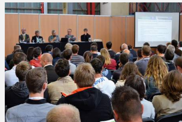
Assises de l'ANC à Limoges