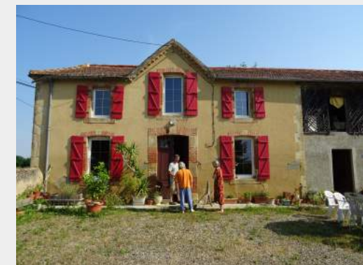
Visite à domicile pour un écodiagnostic