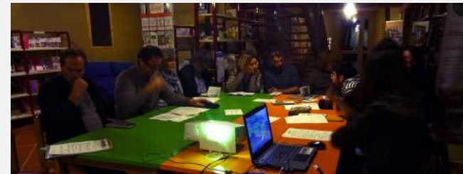
Réunion du CA

Après avoir longtemps prospecté, initié, aujourd'hui les projets viennent à nous, c'est une bonne chose. Grâce à notre équipe, à nos bénévoles, et à nos partenaires l'Écocentre ne cesse d'évoluer et d'accroître son rôle.