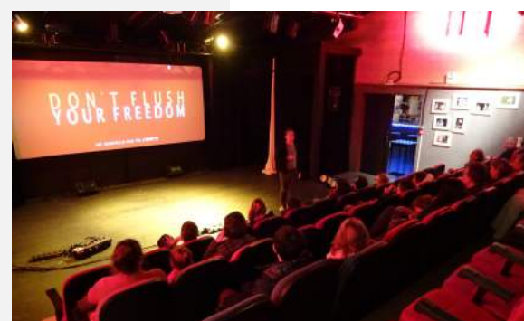
Ciné débat dans la salle du Théâtre Spirale