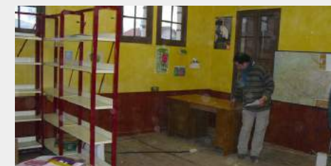
déménagement des bains douches