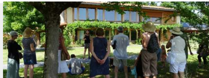
Visite guidée : la construction bioclimatique

Nous avons réalisé 10 interventions délocalisées auprès 1145 personnes sur les salons et les manifestations suivantes : les assises nationales de l'assainissement à Limoges, la fête des Saligues à Cazères sur Adour, Asphodèle à Pau, FestiDrôle à Simorre, à l'Ecofête de Perchède, à Culture y Nature d'Orthez, à la fête de la biodiversité à Bagnères, au Salon de l'agriculture de Tarbes, au salon habitat d'Auch, et au forum sur l'éco parentalité de Nogaro.