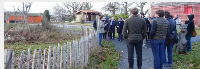
Visite guidée : l'assainissement écologique