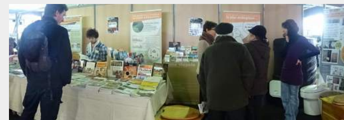
Ecocentre nomade : Salon Asphodèle à Pau