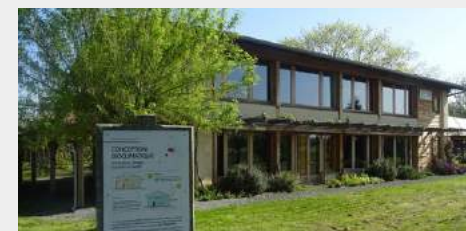
l'écocentre en 2018