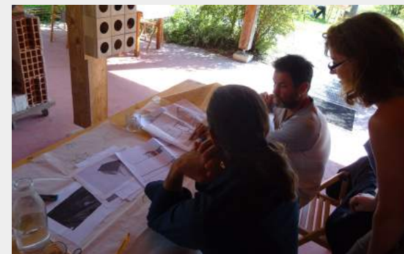
Formation avec l'ADEAR : construire un bâtiment agricole en paille