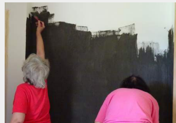
Atelier peintures naturelles