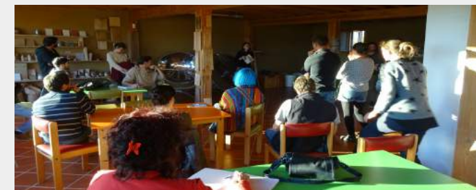
Visite guidée : l'intérieur de l'écocentre