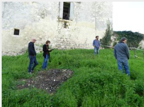
Suivi d'un système ou Étude assainissement pour des particuliers