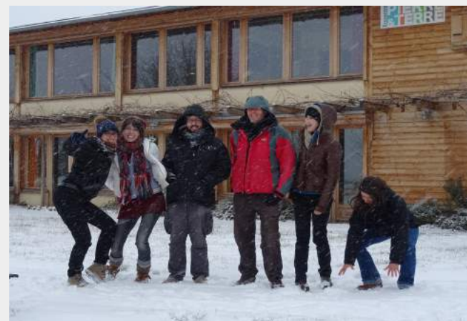
l'équipe de salariés sous la neige

Pour assurer un développement cohérent de nos activités nous avons poursuivi la démarche de comptabilité sectorisée , en dissociant nos activités en 3 catégories : 1) Les activités associatives financées par les fonds publics (conventionnées), 2) Les activités associatives financées par les bénéficiaires (non conventionnées), 3) Les activités marchandes (concurrentielles). Cette organisation permet d'attester que les activités associatives restent prépondérantes et que nous respectons les règles fiscales applicables aux activités marchandes.