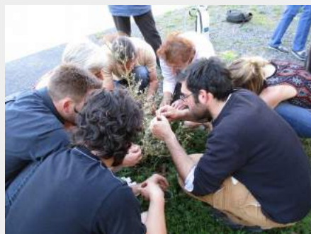
Alternatives aux pesticides