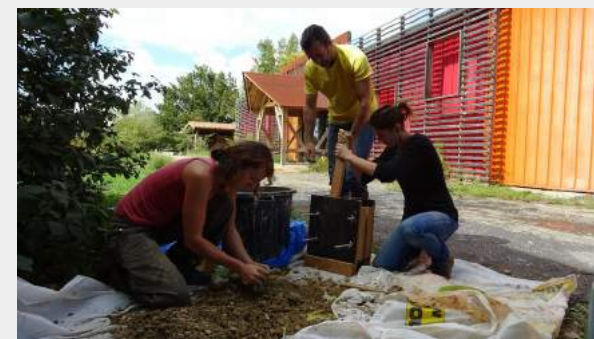
Atelier terre crue