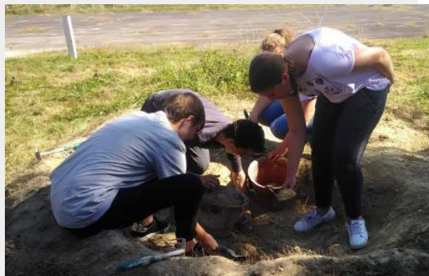
Espace Jeunes : séjour Montagne et atelier terre