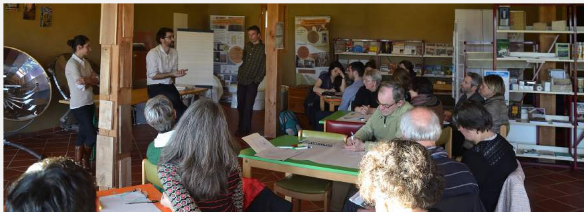
Rencontre des acteurs de la transition alimentaire sur le PVA et le Gers