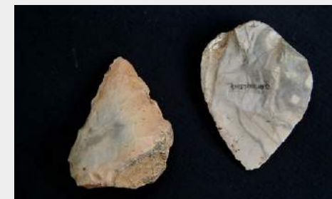
pierres du Néolithique de la vallée de l'Adour gersois