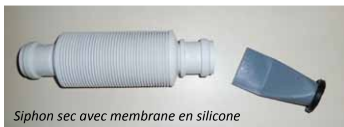
Siphon sec avec membrane en silicone