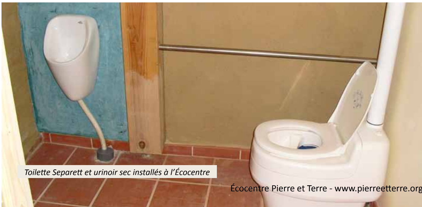
Toilette Separett et urinoir sec installés à l'Écocentre

Toilette : 839 € (tarif 2014) Tuyau PVC diamètre 50 mm : 2.5 €/ml Tuyau PVC AEP diamètre 80 mm : 3 €/ml