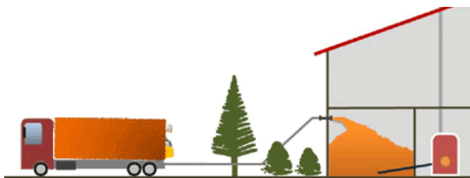
schéma de principe : le remplissage du silo se fait par soufflerie (par raccord pompier) soit un rendement de 4 Tonnes/H.